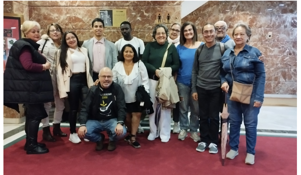
Un grupo de personas participantes del Programa Teranga Ourense en la Muestra Internacional de Teatro de Ourense (MITEU) en el Teatro Principal de la ciudad.