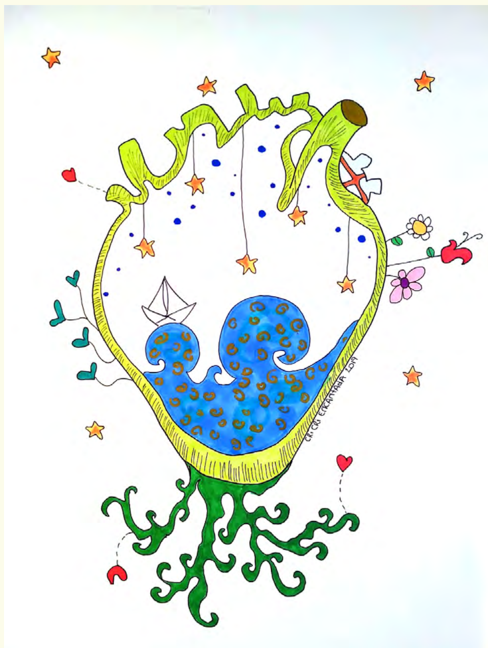
Imagen cortesía de Cri Cri Encantada, artista y educadora del Tragaluz.

El Tragaluz no es sólo un proyecto de acogida, protección, integración y desarrollo integral de la vida para jóvenes entre los 15 y los 18 años (o más), sino que pretende ser un HOGAR al servicio de las familias donde los chicos y chicas aprenden a autogestionar su vida, enfrentar sus miedos y resolver sus conflictos internos y externos con la compañía y relación cercana, atenta y consciente de unos educadores que aprovechan las situaciones cotidianas (y a veces no tan cotidianas) del día a día para mostrar que todos tenemos capacidades para afrontar una vida que aunque a veces se ponga “cuesta arriba”, siempre merece la pena ser vivida...y ABRAZADA.