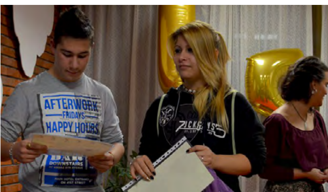
Concurso del MicroRap: Tema premiado “Ten Cuidao”