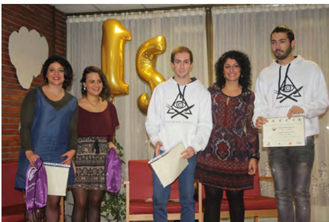
Concurso de MicroRap Tema premiado “Números Cardenales”