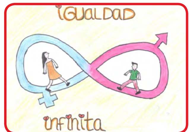
Amparo Ramírez Categoría de más 18 años